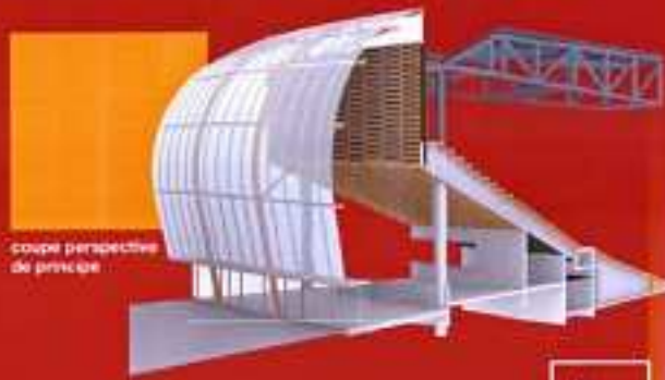
coupe perspective de principe