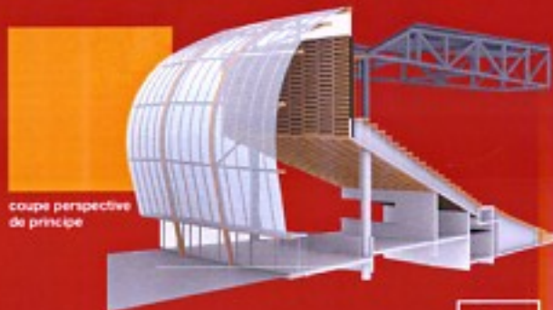
coupe perspective de principe