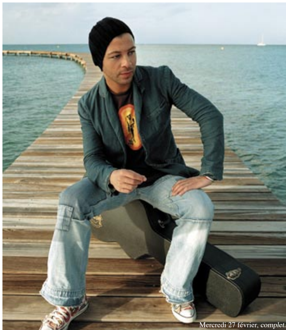
Mercredi 27 février, complet.