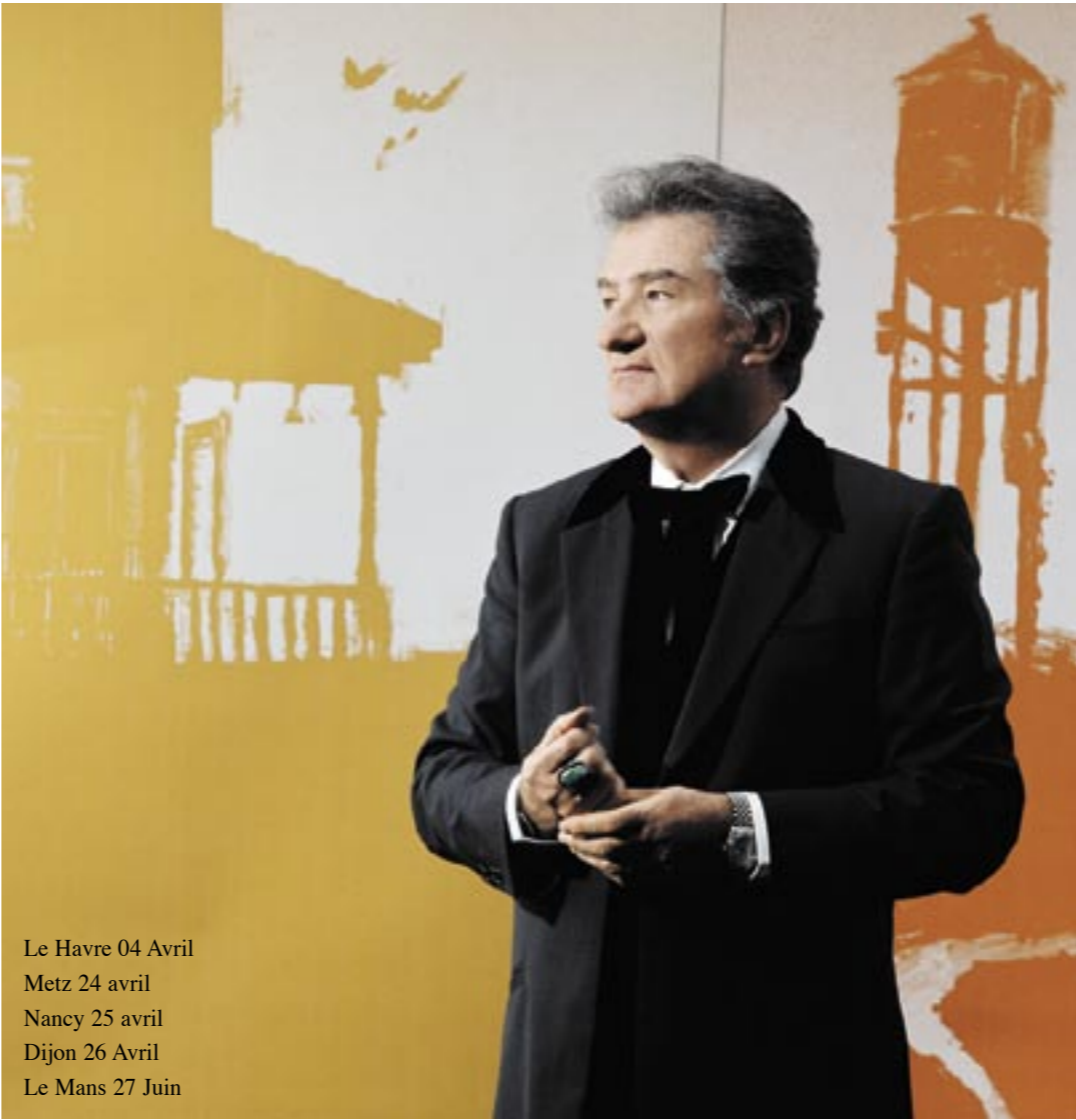
Le Havre 04 Avril Metz 24 avril Nancy 25 avril Dijon 26 Avril Le Mans 27 Juin

Le téléchargement, le piratage, la merde ! C’est irréversible. Un jour ou l’autre on ira tous vendre des pizzas, y’aura rien d’autre à faire. Ca va devenir la Russie ! Pour le disque tout se limitera à une coopérative où on amènera nos petites bandes et puis voilà ! Ce sera peut-être mieux en Afrique, il y fait meilleur.