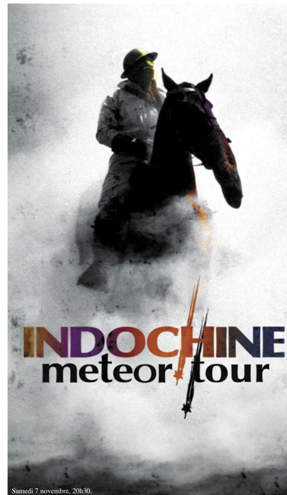
Samedi 7 novembre, 20h30.