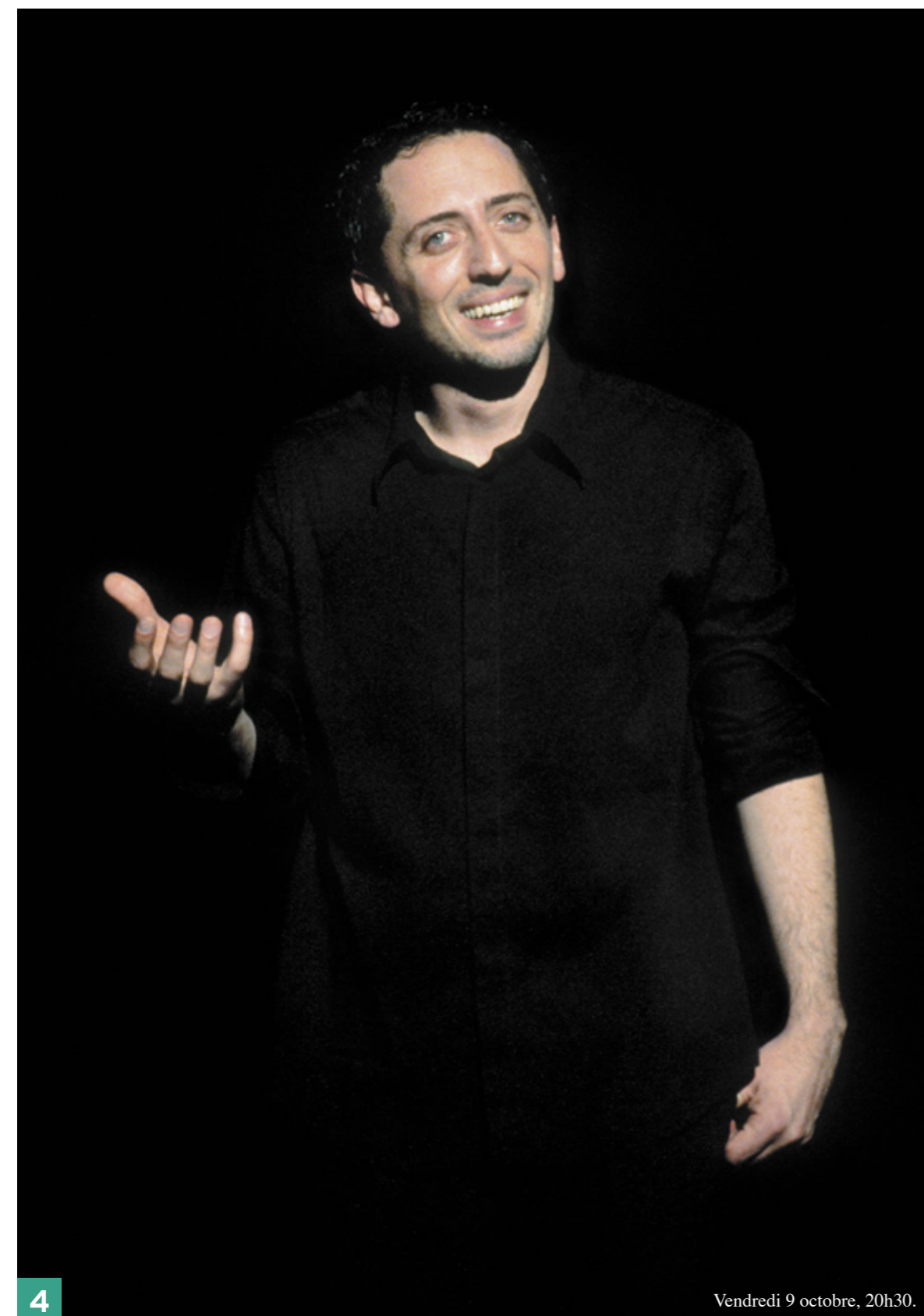
Vendredi 9 octobre, 20h30.