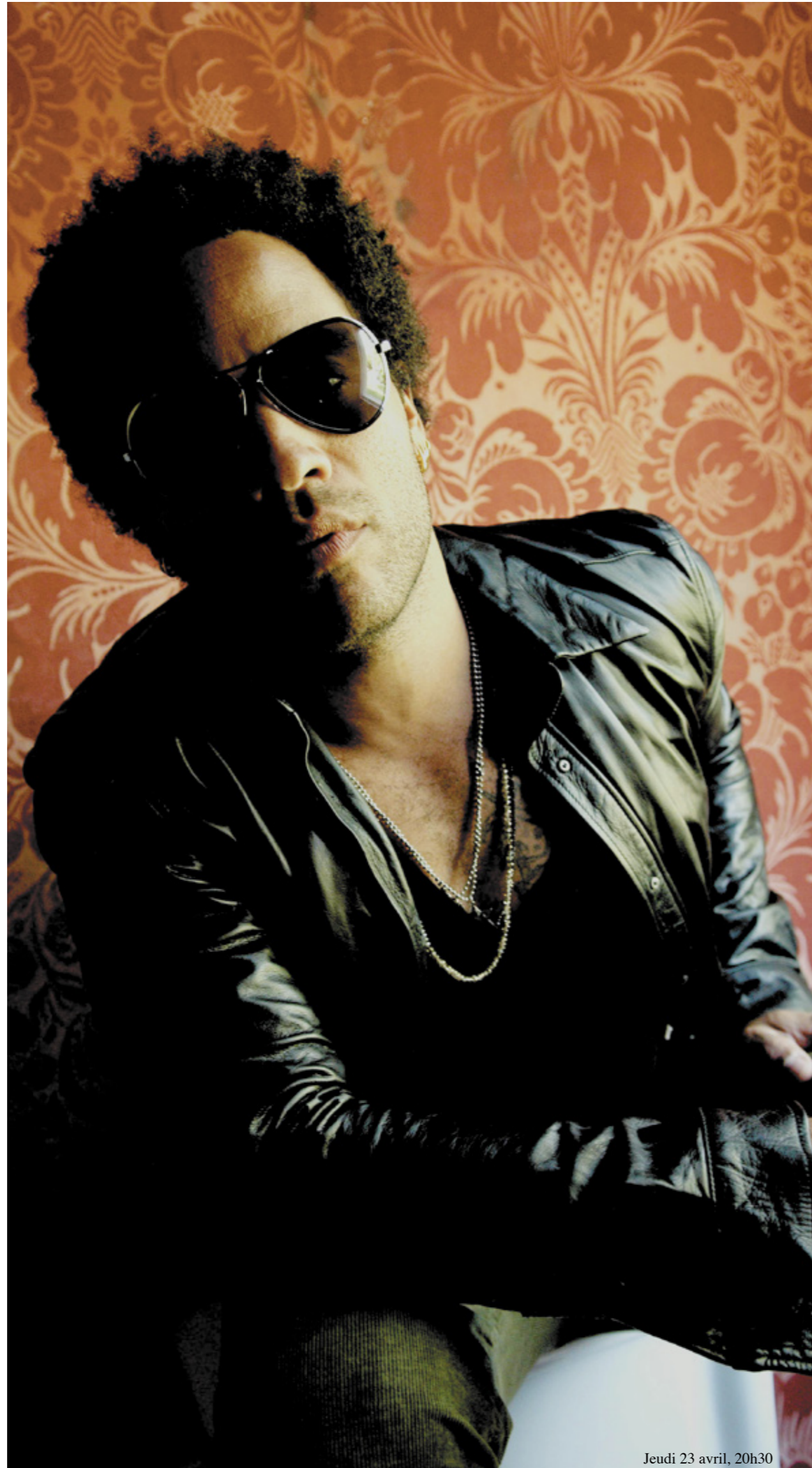
Jeudi 23 avril, 20h30

1989... L'Europe est la première à se prendre de passion pour « Let love rule », première réalisation sur laquelle « le jeune homme » passe avec un bonheur impertinent d'un instrument à l'autre. On navigue entre l'impression d'être confronté à un prodige ou un à phénomène tant ces sons qu'il assène, sans avoir recourt à un quelconque requin de studio, un exécutant passé par tous les états de la musique, vont torpiller la mémoire dans ce qu'elle a de plus précieux. Le style Kravitz vient de naître porté par quelques singles imparables dont « I built this garden for us » que n'auraient pas reniés les Fab Four. Et comment, s'en cacher... Retrouver des ballades de cette richesse est un bonheur absolu, à commencer pour l'oreille avant de mesurer toutes ces sensations enfouies qu'elles portent à la vibration. Les clips signés Jean-Baptiste Mondino font le reste. Dans la foulée de « symphonies » comme celle-là, le psychédélique reprend sa dimension d'électrochoc. Comme hier, le rock effectue un retour vers le flamboiement. De quoi effrayer, bien sûr, quelques puristes, les brouiller avec l'ordre habituel des choses que rien et, surtout, personne ne devraient jamais bousculer.