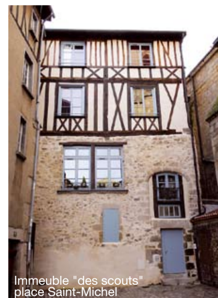
Immeuble "des scouts" place Saint-Michel