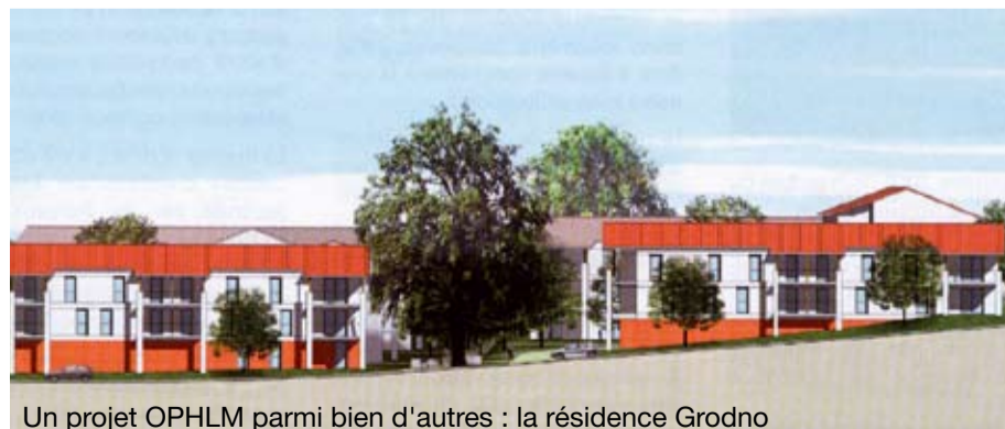
Un projet OPHLM parmi bien d'autres : la résidence Grodno

Actuellement à Limoges, plus de 1 000 logements neufs sortent de terre chaque année, à l'initiative de promoteurs privés, de particuliers, ou dans le cadre d'opérations conduites par les offices HLM. 28,9% sont des logements sociaux. C'est là le signe d'un engagement fort, alors que la loi SRU impose "seulement" 20% de ces mêmes logements aux communes, et que nombre d'entre elles sont loin de répondre à cette obligation.