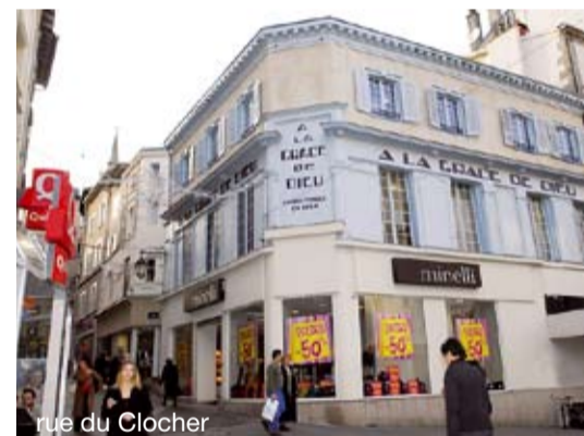
rue du Clocher

Cœur de Limoges, 4 bis, pl. Haute-Vienne, 05 55 79 00 07, coeurdelimoges.fr.