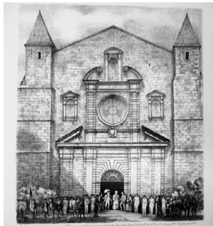
Claude Chanteraud : Le sénéchal et Mgr l'évêque accueillent les représentants des Trois ordres dans la chapelle du collège le 11 mars 1789.

Un siècle à peine après son ouverture, le collège compte déjà un millier d'élèves. En 1685, ils sont 1 500, originaires du Limousin ou des régions limitrophes , venus à Limoges profiter (gratuitement pour les enfants issus des "petites écoles" et certains auditeurs libres) de l'enseignement d'une quinzaine de professeurs. Au programme ne figurent plus alors les seules matières du "trivium", comme à l'origine, mais aussi les belles-lettres, la philosophie, et même la théologie, Limoges ne possédant pas de séminaire. Une nouvelle modernisation des programmes surviendra à partir de 1762 avec la suppression de l'ordre des jésuites et le retour au sein du collège, alors "royal", de prêtres séculiers professant pour la première fois la littérature française, la géographie ou les sciences. De cette époque date également la mise en place de certains usages pour la plupart toujours en vigueur, notamment les compositions, les examens, les classements et les distributions de prix. Parallèlement à ces évolutions pédagogiques, les changements architecturaux sont également importants. De l'arrivée des jésuites à la fin du XVIII e siècle, en seulement deux siècles,