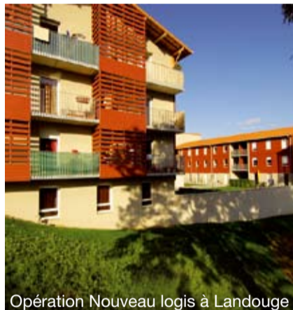
Opération Nouveau logis à Landouge

• favoriser le retour des familles en centre-ville en réhabilitant le patrimoine ancien et en mettant sur le marché des logements de grande taille plutôt que des studios ;